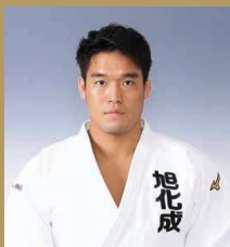
羽賀 龍之介氏 柔道 リオオリンピック 100kg級銅メダリスト