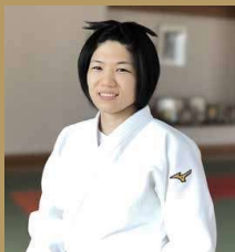
中村 美里氏 柔道 北京/リオオリンピック 52kg級銅メダリスト