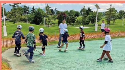
スケートボード体験