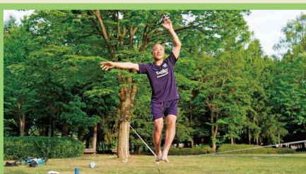
スラックライン体験