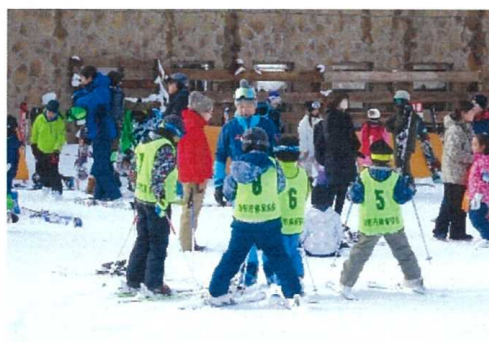
(山形市民スキー教室)