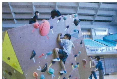
(ボルダリング体験)