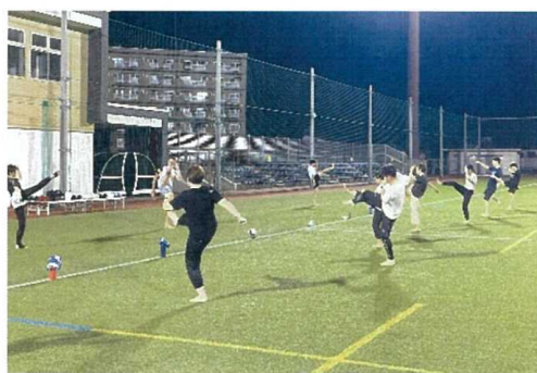
(ムエタイ・キックボクシング教室)