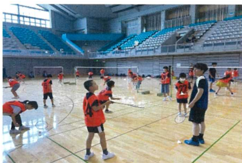
（屋内種目：バドミントン）